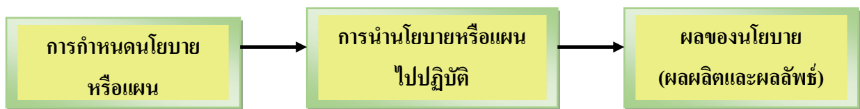
ภาพประกอบ ๕ การปฏิบัติงานตามภารกิจและหน้าที่ขององค์กรปกครองส่วนท้องถิ่น (สุวรรณ พินิตานนท์ ๒๕๔๕ : ๒๙)

จากหลักการปกครองท้องถิ่นที่กล่าวมาข้างต้น จะเห็นว่าการพัฒนาท้องถิ่นขององค์กรปกครองส่วนท้องถิ่น คือ การแก้ไขปัญหาและสนองตอบความต้องการของท้องถิ่น เพื่อให้ท้องถิ่นมีความเจริญก้าวหน้ามีฐานะเศรษฐกิจที่ดี มีความเป็นอยู่ที่ดีและสะดวกสบาย แต่เนื่องจากปัญหาและความต้องการของแต่ละท้องถิ่นมีความแตกต่างกัน ดังนั้น การแก้ไขปัญหาและการตอบสนองความต้องการของแต่ละท้องถิ่นจึงมีความแตกต่างกันออกไปตามปัญหาและความต้องการของท้องถิ่นนั้น ๆ ปัญหาและความต้องการของท้องถิ่นหนึ่งอาจจะไม่ใช่ปัญหาและความต้องการของอีกท้องถิ่นหนึ่งก็ได้ เมื่อเป็นเช่นนี้ ท้องถิ่นใดมีปัญหาและความต้องการด้านใด ก็จะทำให้ความสำคัญและมุ่งเน้นที่จะแก้ไขปัญหาและสนองตอบความต้องการด้านนั้น ๆ เป็นหลัก ในการดำเนินการแก้ไขปัญหาและสนองตอบความต้องการของท้องถิ่นไม่ว่าด้านใดก็ตาม องค์กรปกครองส่วนท้องถิ่นในฐานะที่เป็นองค์การสาธารณะ (Public Organization) (Bresnick. ๑๙๘๒ : ๖-๗ ; พิทยา บวรวัฒนา ๒๕๔๑ : ๑) จะมีบทบาทเป็นตัวแสดงนโยบายเจ้าของเรื่อง (Focal Policy Actor) ซึ่งมีขั้นตอนการปฏิบัติงานตามภารกิจและหน้าที่ตามกระบวนการนโยบายสาธารณะ (Public Policy Process) (Milward. ๑๙๘๒ : ๔๕๗ - ๔๗๘ ; พิทยา บวรวัฒนา. ๒๕๔๑ : ๒๐๗ - ๒๑๗) กล่าวคือ จะเริ่มจากการกำหนดนโยบายหรือแผนก่อน จากนั้นนำนโยบายหรือแผนที่กำหนดขึ้นไปปฏิบัติให้ประสบผลสำเร็จ จนได้รับผลงาน (outputs) ผลลัพธ์ (outcomes) ออกมาเมื่อเป็นเช่นนี้ ภารกิจและหน้าที่ขององค์กรปกครองส่วนท้องถิ่น จึงหมายถึงการดำเนินการแก้ไขปัญหาและสนองตอบความต้องการของท้องถิ่น ซึ่งประกอบด้วย การจัดทำแผนพัฒนาท้องถิ่น การนำแผนพัฒนาท้องถิ่นไปปฏิบัติ และผลของแผนพัฒนาท้องถิ่น (ผลผลิตและผลลัพธ์) ดังภาพประกอบนี้