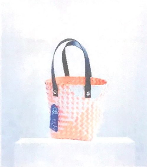
กระเป๋าทรงถัง สายหัวหนัง ยาว 45 ซม. ราคา 359 บาท