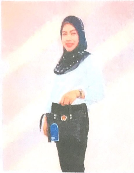
กระเป๋าสะพายข้าง สายสะพายหนัง ยาว 150 ซม. ราคา 379 บาท