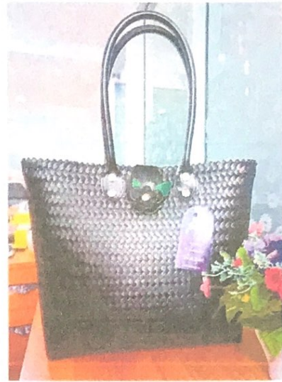
กระเป๋าทรงซิปป์ สายหิ้วหนังยาว 60 ซม. ราคา 799 บาท