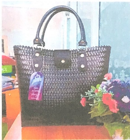
กระเป๋าทรงซิปป์ สายหิ้วหนังยาว 40 ซม. ราคา 799 บาท