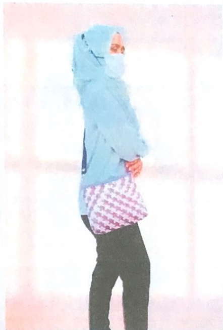
กระเป๋าสะพายข้าง สายสะพายหนัง ยาว 150 ซม. แบบมีซิป ราคา 469 บาท