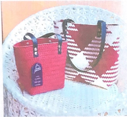
เซตคู่ กระเป๋าทรงช้อปปีง สายหัวหนังยาว 95 ซม. + กระเป๋าทรงถัง สายหัวหนัง ยาว 45 ซม. ราคา 999 บาท