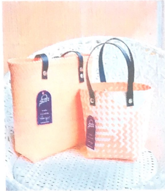
เซตคู่ กระเป๋าทรงช้อปปีงทรงสูง สายหัวหนังยาว 95 ซม. + กระเป๋าทรงถัง สายหัวหนัง ยาว 45 ซม.