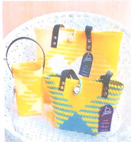
ครบเซต 3 ใบ ปลอกเยติ ขนาด 24 ออนซ์ 700 ML + กระเป๋าทรงช้อปปีง สายหัวหนังยาว 95 ซม. + กระเป๋าทรงถัง สายหัวหนัง ยาว 45 ซม. ราคา 1,230 บาท