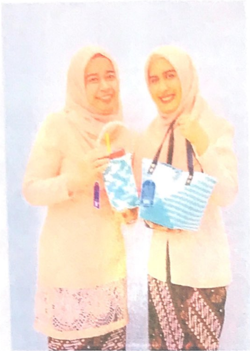
เซตคู่ ปลอกเยติ ขนาด 24 ออนซ์ 700 ML + กระเป๋าทรงถัง สายหัวหนัง ยาว 45 ซม. ราคา 659 บาท