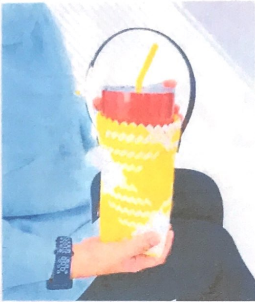
ปลอกใส่แก้วเยติ ขนาด 24 ออนซ์ 700 ML ราคา 269 บาท